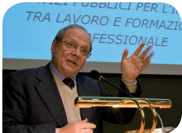
▶ Tiziano Treu