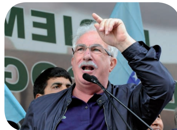
▶ Raffaele Bonanni